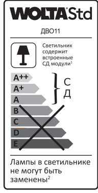
1 Шамда кірістірілген ЖД модулері бар